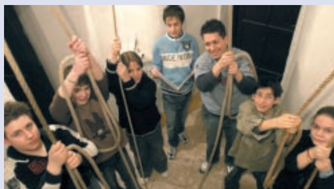
Le giovani promesse del Gruppo Campanari di Dolcè