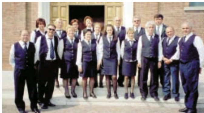
Foto di gruppo della Corale S. Lucia