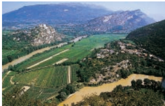
Ceraino con l'ansa dell'Adige

È stato realizzato, infine, un intervento di potenziamento delle caditoie e dei pozzi perdenti sul parcheggio sito in prossimità dello stabilimento BMW, dato che la rete esistente non era più in grado di smaltire le acque meteoriche che vi si riversavano.