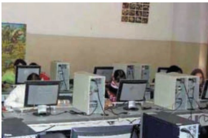
I nuovi monitor in funzione nel laboratorio di informatica

il reperimento dei fondi necessari per la sostituzione dei 15 monitor. Credo –continua Raineri- che la risposta positiva di queste aziende a favore delle esigenze della nostra scuola, in questo particolare periodo di difficoltà che colpisce anche l'economia locale, sia un segnale importante. E la mia speranza è che questo sia solo un primo passo verso una sinergia fra il mondo della scuola e quello dell'impresa, sinergia che può portare verso un miglioramento dell'offerta formativa dei