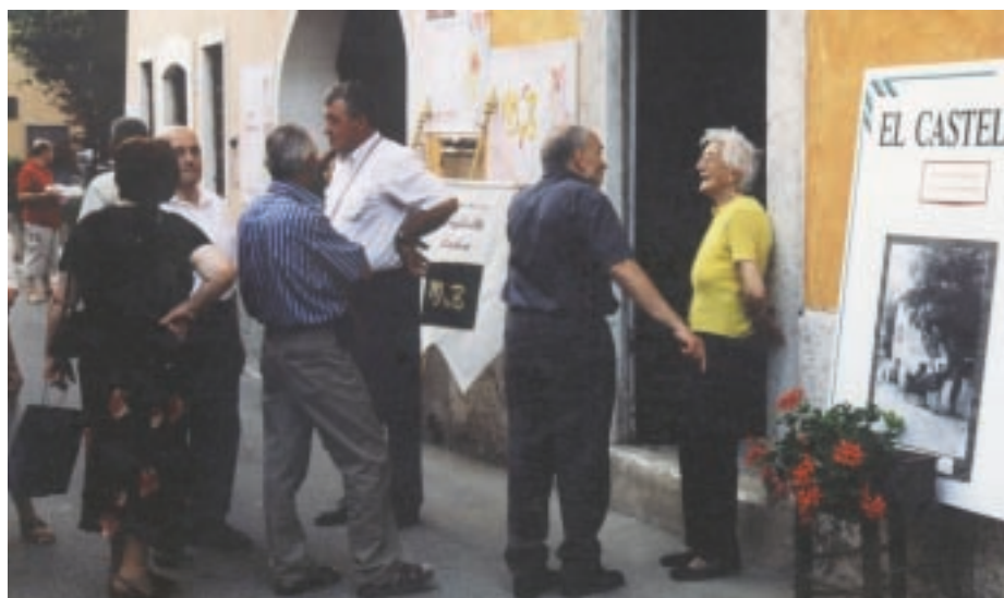
L'ingresso della mostra fotografica curata dal gruppo culturale “El Casteleto”

superato di gran lunga la disponibilità di posti) la discesa in rafting dell'Adige sui gommoni messi a disposizione dal Canoa Club Pescantina: dall'isola di Dolcè alla Chiusa di Ceraino. Intensa e di grande qualità pure l'offerta squisitamente culturale, con la mostra di pittura presso il palazzo comunale e la mostra fotografica, curata all'insegna della consueta maestria, dal gruppo culturale “El Casteleto” a palazzo Rizzardi. Apprezzato come non mai, sempre nella sontuosa sede che fu residenza del conte Guerrieri-Rizzardi, il “laboratorio del gusto”, in collaborazione con Slow food Terre dei Forti, che ha messo in vetrina i formaggi della Terradeiforti. Ma sono piaciuti