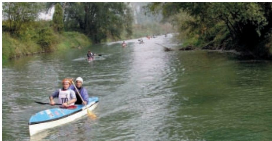
Una fase della Maratona Internazionale svoltasi lo scorso anno