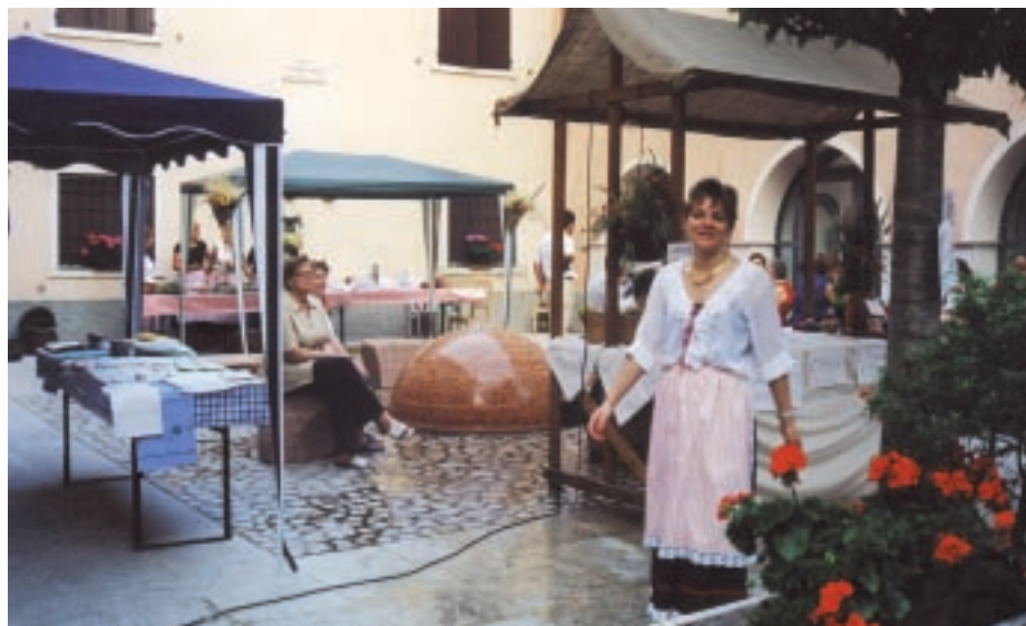
Le bancarelle dedicate alla lavorazione dei merletti