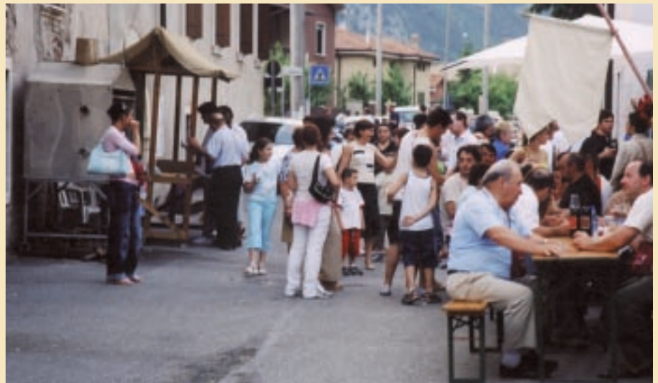
Un momento della festa "Storia e sapori tra Borghi e Castelli"

D ue giornate intense, ricche di appuntamenti, davvero indimenticabili, di cui è stata protagonista l'intera cittadinanza del Comune, che si è mobilitata con straordinario calore umano per accogliere i visitatori giunti da ogni parte: migliaia di persone desiderose di conoscere e apprezzare i luoghi più suggestivi del nostro paese assaggiando i prodotti tipici del territorio circostante. Sabato 28 e domenica 29 maggio "Storia e sapori tra borghi e castelli", la tradizionale manifestazione organizzata dal Consorzio Tutela Vini Terradei-forti, si è conclusa con un grande suc-