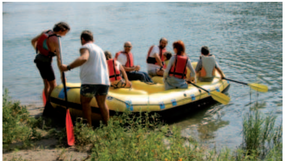
Si sale sul gommone per il rafting lungo il corso dell'Adige