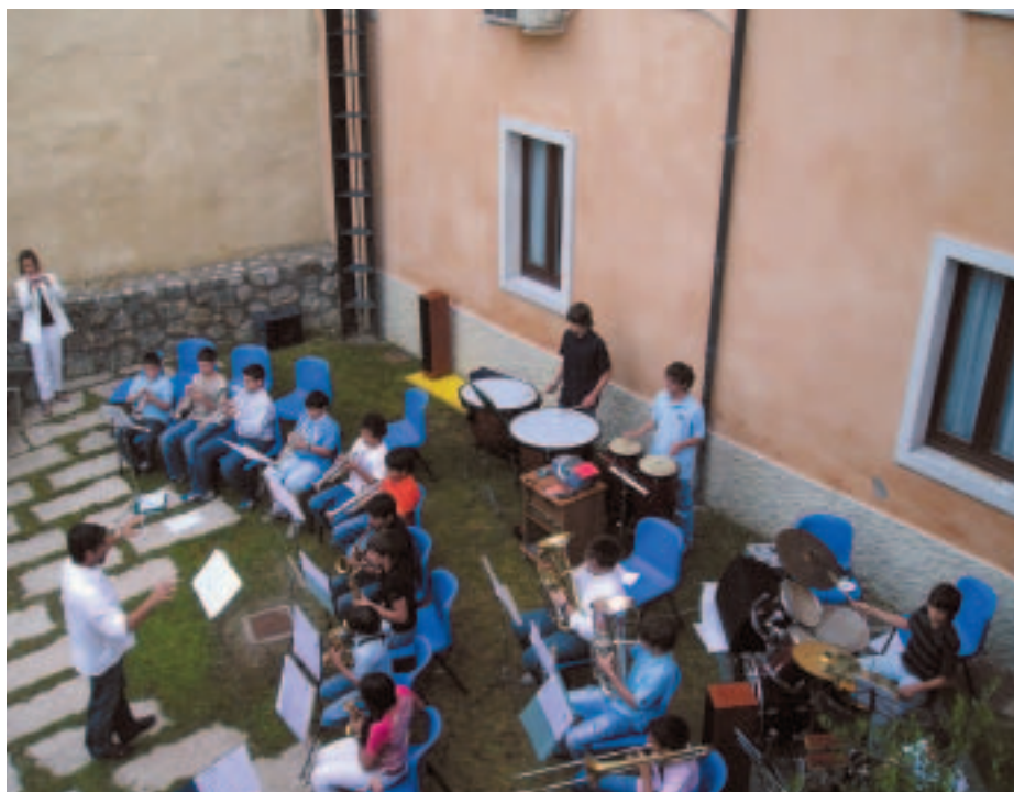
Un momento del saggio finale 2007 della Scuola di Formazione musicale