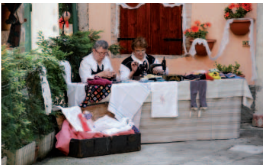
Nella corte... spazio all'esposizione di magnifici merletti