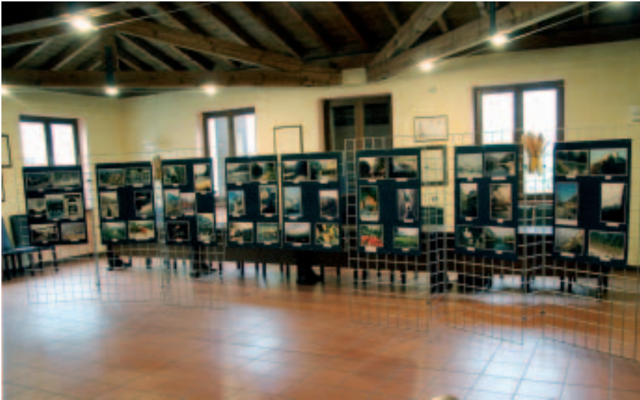
L'allestimento della mostra fotografica "La Valdadige nel cuore"