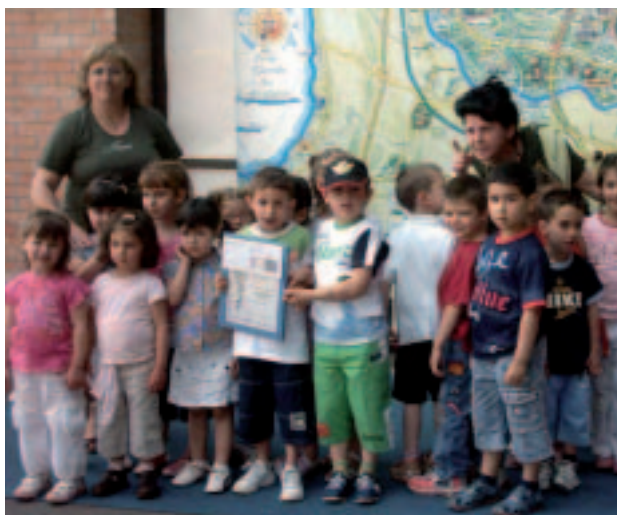
La premiazione della scuola d'infanzia di Dolcè alla Primavera del Libro di Fumane

si raccontano la storia di alcuni animali – il pulcino, la farfalla, il topino, la chiocciola, il gufo, il pesce, il maialino ed il gatto – e racchiudono il pensiero che, seppur diversi per alcuni aspetti come quelli legati a fisico, ambiente, abitudini, sono anche le stesse cose che li accomunano perché tutti hanno, per esempio, due occhi, una bocca, una casa, una mamma, una storia. Perciò si può essere amici, scoprendo e scambiandosi cose nuove o diverse con le qua-