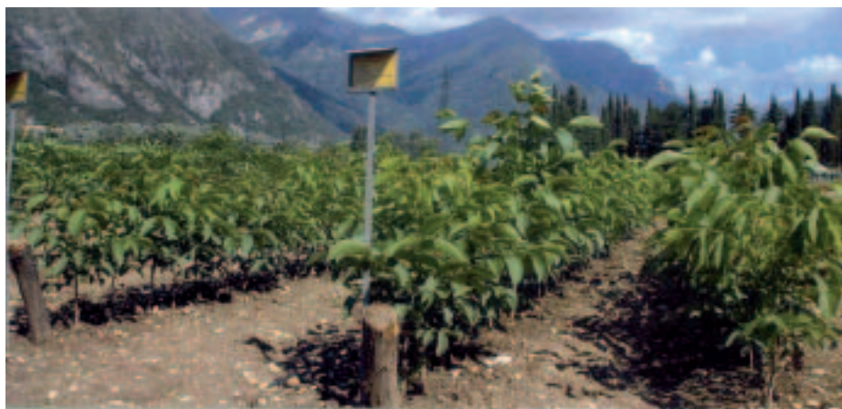
Il vivaio del Sementificio di Peri

internazionale”. Tra questi spicca il giardino botanico della Regina Elisabetta d'Inghilterra. “Oggi il centro”, ha concluso il dottor Zillich, “occupa una trentina di persone, la cui opera garantisce un futuro al sementificio. Accanto alle attività tradizionali continuiamo nella ricerca di metodologie per la produzione di materiali che posseggano sicure caratteristiche genetiche. Ci confrontiamo quotidianamente con l'estero che ci richiede collaborazione. A dimostrazione che, con serietà e professionalità, si può lavorare con soddisfazione nel nostro come negli altri Paesi”.