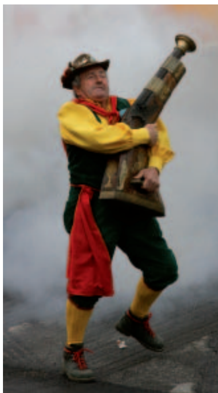
Un robusto pistoniere all'opera!

S toria e Sapori tra Borghi e Castelli ha fatto centro per la terza volta offrendo un mix azzeccato di eventi consolidati e stimolanti novità. La meravigliosa festa della Terradeiforti – promossa dal Consorzio Tutela Vini Terradeiforti in efficace sinergia con l'Amministrazione Comunale di Dolcè, la Strada del Vino e dei Prodotti Tipici, le varie associazioni e lo Iat Terradeiforti - non ha deluso le attese. Nonostante i dispetti di un sabato piovoso, domenica 3 giugno, approfittando della calda giornata estiva, migliaia di visitatori si sono riversati nelle corti colorate. Tutta la comunità cittadina, in una gara di grande generosità, si è prodigata con straordinaria passione per accogliere calorosamente i graditi ospiti. Rinverdendo il proprio glorioso passato, questa terra lungo la Valle dell'Adige si è immersa per tre giorni - da venerdì 1 a domenica 3 giugno - nelle proprie migliori tradizioni, facendo rivivere il culto genuino dell'ospitalità.