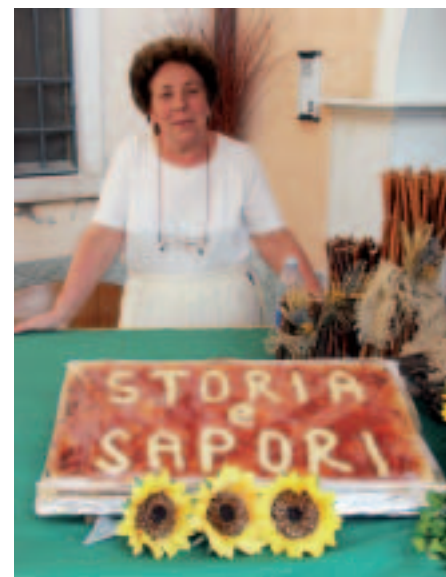
In posa con una composizione artistica