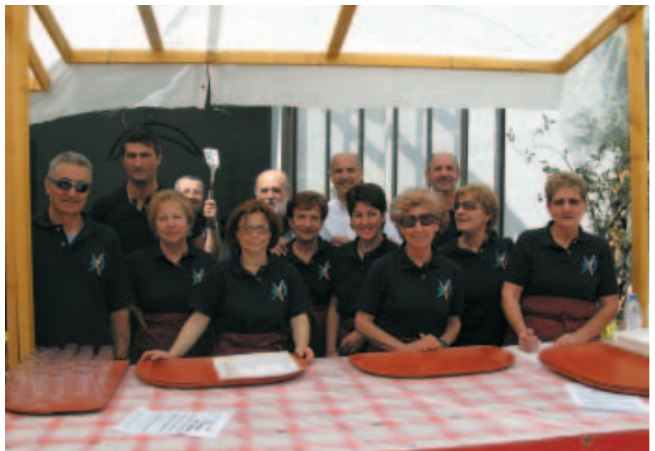
Una bella foto di gruppo per lo staff del Comitato Europa Amica