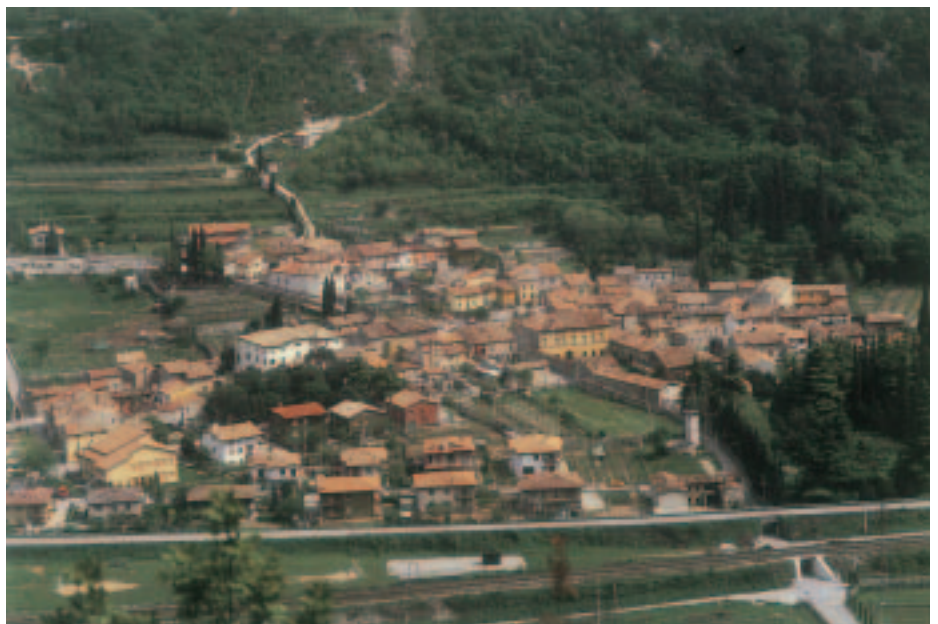
Il centro storico di Dolcè visto da occidente