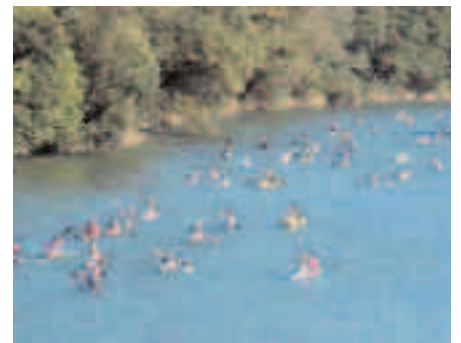
Istantanee lungo il fiume