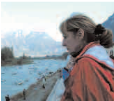
Sara Simeoni a Borghetto d'Avio