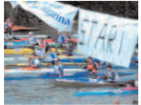
La partenza a Borghetto d'Avio