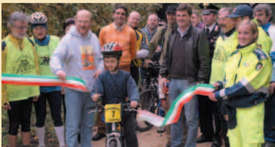
Latteso momento del taglio del nastro