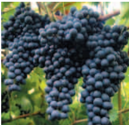
Grappoli di Enantio