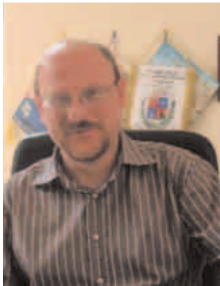
Il sindaco Luca Manzelli

“È una sfida che l'Amministrazione comunale sta portando avanti convinta, cercando di coniugare al meglio, nell'interesse dei cittadini di Dolcè, le iniziative volte a far conoscere le risorse paesaggistiche che la nostra meravigliosa vallata possiede, con la primaria necessità di salvaguardarne il territorio. Sotto quest'ultimo aspetto, è nostra intenzione difenderne l'integrità anche attraverso un'opposizione ragionata all'apertura di nuove cave, continuando a batterci contro l'assalto selvaggio, la speculazione e il degrado. Sul piano della promozione turistica abbiamo lavorato molto per favorire la messa in rete di tutti i soggetti - pubblici e privati - impegnati a vario tito-