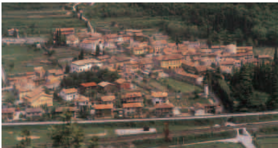
Bella veduta panoramica dell'abitato di Dolcè

“Ce ne sono alcune di grande interesse, perché indicano una via precisa da percorrere nel rapporto tra Amministrazione, associazioni e cittadini. Per esempio, il progetto like move per l'utilizzo delle palestre comunali, garantendo l'uso gratuito alle società che collaborano con l'Amministrazione Comunale alla loro gestione e tariffe di accesso agevolate alla cittadinanza. Un intervento assai qualificato, direi quasi esclusivo, portato avanti dalla Giunta nell'ambito dei servizi socio-assistenziali, è l'assistenza domiciliare: il Comune di Dolcè è tra i pochi ad averla organizzata e a svilupparla con risultati assai validi.