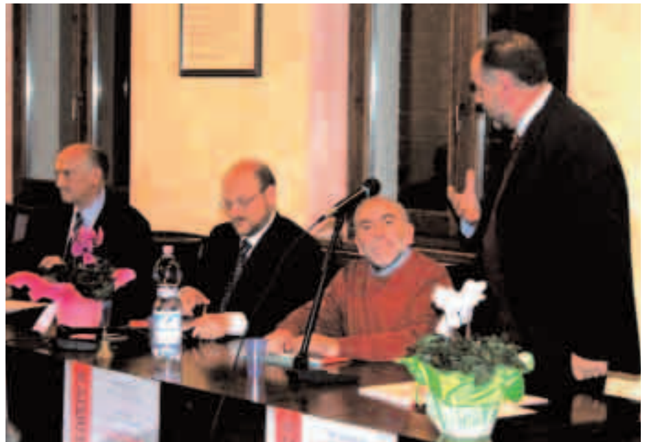
Il tavolo dei relatori

Anche quest’anno, come in passato, la pubblicazione proposta e distribuita all’ingresso a lettori ed appassionati estimatori è apparsa subito particolarmente “ricca”, e molti hanno iniziato a sfogliarla – con grande curiosità – nei brevi momenti precedenti l’avvio della serata, allietati dalla proiezione sul grande schermo delle magiche istantanee sulla Valdadige del fotografo Gianni Buio. Stavolta, il filo conduttore di molti interventi ha rappresentato, in un certo senso, una sorta di ritorno alle origini per il gruppo – sorto per denunciare e ostacolare il pericolo di devastazione della vallata. Infatti, all’orizzonte si profilano nuove, minacciose nubi rappresentate sia dalla reiterata ri-