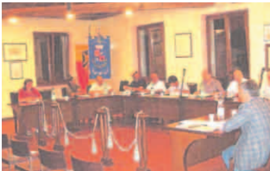
Una seduta del Consiglio Comunale

“Un messaggio di fiducia nel rapporto con l'Amministrazione e l'invito ad essere propositivi, partecipi e responsabili. J.F. Kennedy diceva una frase che credo possa esprimere meglio di ogni altro ragionamento il senso del mio appello: Invece di chiedere cosa fa lo Stato per te, pensa a cosa