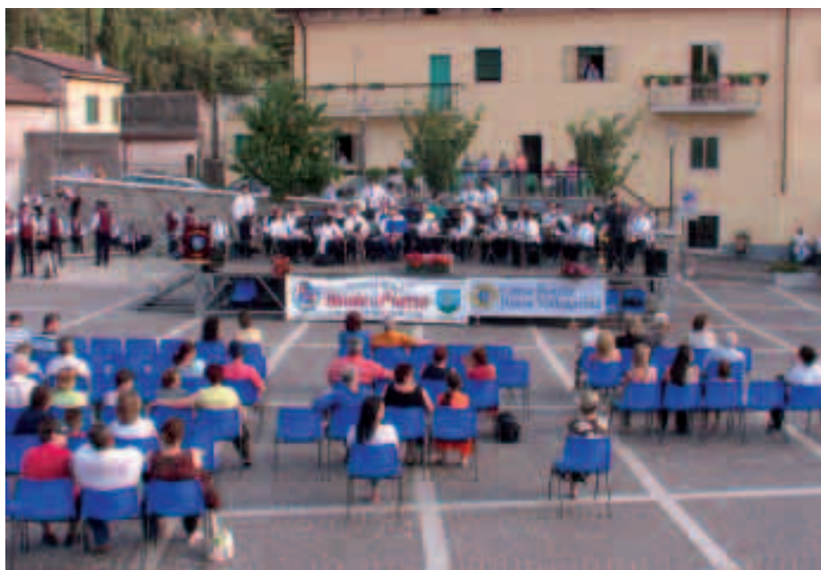
Un momento di "Bande in Piazza", che si è svolta domenica 18 giugno a Dolcè

"Certamente, se ne è parlato proprio all'ultimo consiglio direttivo. Stiamo