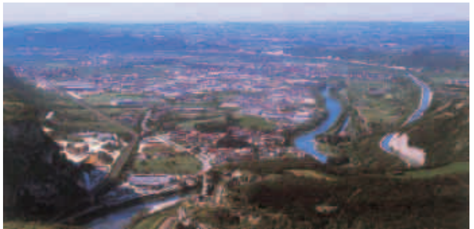
La piana di Volargne vista dalla Vallagarina

I raccordi del nuovo sottopasso con i percorsi pedonali adiacenti saranno realizzati con tratti di nuovi marciapiedi, di cui quello lungo via XXI Novembre correrà a fianco della rampa ovest, lasciando anche lo spazio per ricavare alcuni stalli di sosta per le auto.