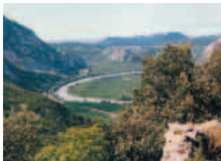
Una bella immagine panoramica della vallata.

Un nuovo passo avanti! L'ha compiuto il progetto Iat in Terradeiforti. Il nuovo ufficio turistico troverà ubicazione, a partire da maggio, nell'attuale sede del Consorzio Tutela Vini in via Brennero 30 a Peri. Diverse le riunioni a cui hanno partecipato rappresentanti delle istituzioni, rappresentanti del consorzio e dello Iat Valpolicella, l'ufficio turistico della Valpolicella con sede a San Pietro in Carriano, di cui lo Iat Terradeiforti costituirà una nuova sede. Obiettivo: diventare un punto di riferimento sia per la ricezione turistica, sia per l'ampliamento di un'offerta da cui emergano le potenzialità delle risorse territoriali, sia per creare sinergie sempre più strette con la Valpolicella. «Attraverso questo ufficio – afferma Piero Grigoli, presidente del Consor-