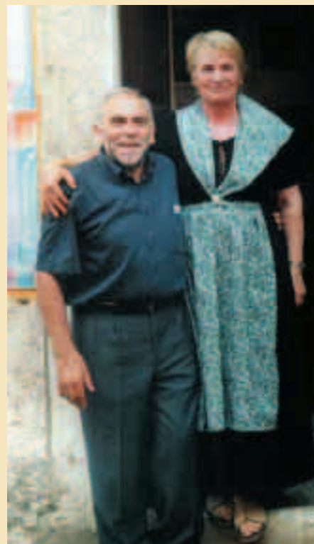
Una bella immagine di "Storia e Sapori" 2005.

Il Sindaco e l'Amministrazione Comunale porgono i migliori auguri di Buona Pasqua a tutti i cittadini e famiglie.