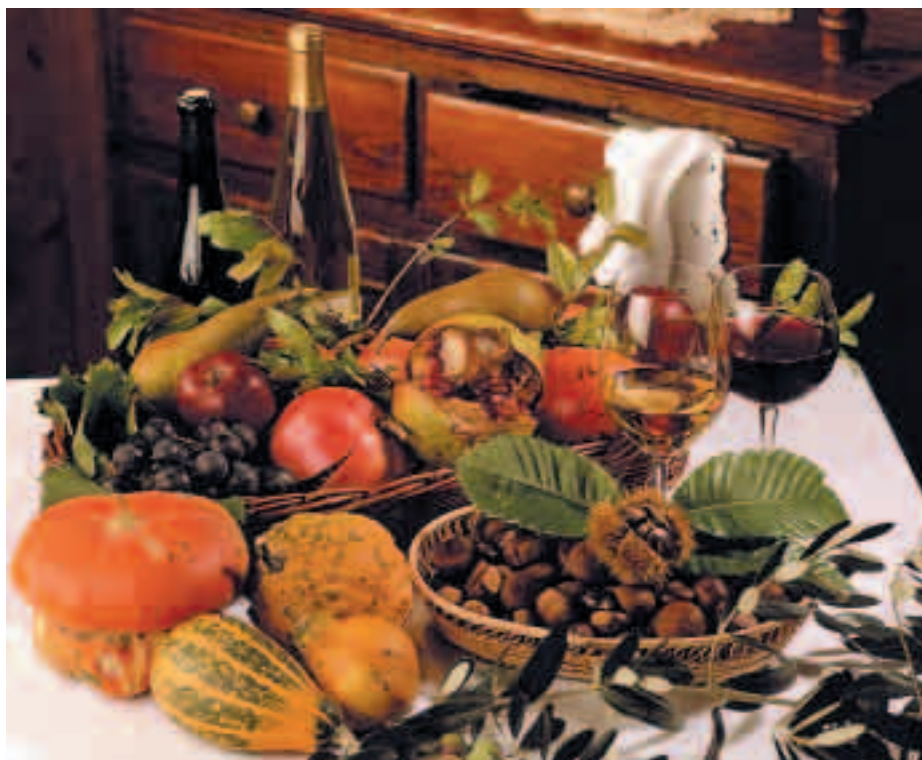
Una bella tavola imbandita della Terradeiforti.