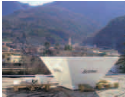
Strumento sodar per il telerilevamento dei profili di velocità e direzione del vento in quota.

"L'intento principale è valutare l'impatto ambientale dei trasporti transalpini. In queste aree, infatti, la meteorologia locale è fortemente influenzata dall'orografia, e la complessa variabilità dei fenomeni influisce sia sul trasporto degli inquinanti e sulla propagazione del suono, sia sugli effetti che da essa subisce l'uomo. Il progetto si concentra su due principali cor-