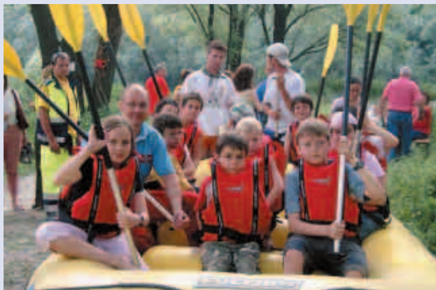
Tutti pronti per un fantastico rafting sull'Adige!