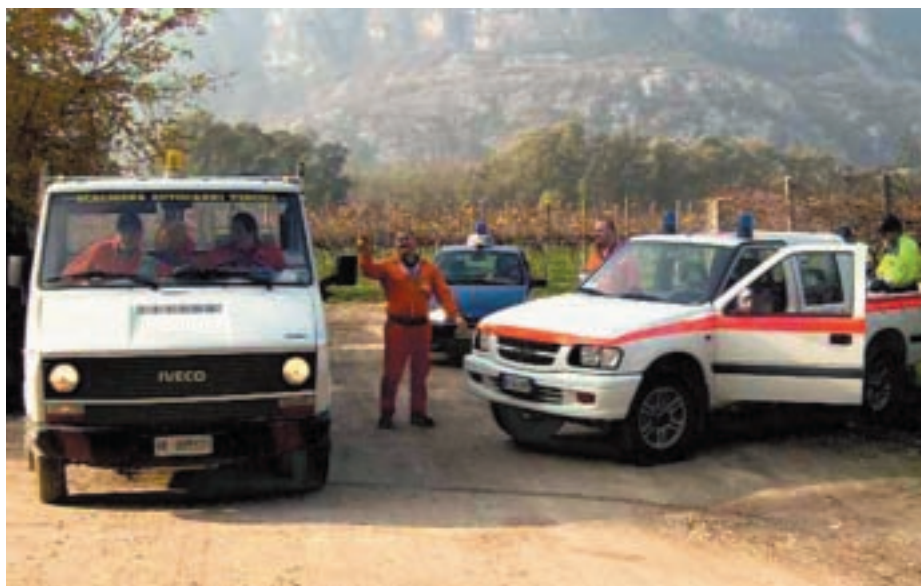
I volontari del Gruppo Ecologico di Dolcè al lavoro

di Dolcè – che la maggioranza della cittadinanza usufruisce dei servizi di raccolta dei rifiuti nel rispetto dell'ambiente e degli altri cittadini. Resta una minoranza che, non si capisce perché, continui a deturpare il nostro ambiente, che poi è anche loro. Continuerà l'opera di prevenzione e sanzionatoria da parte dei competenti uffici comunali». Il prossimo appuntamento con la 7° Giornata Ecologica