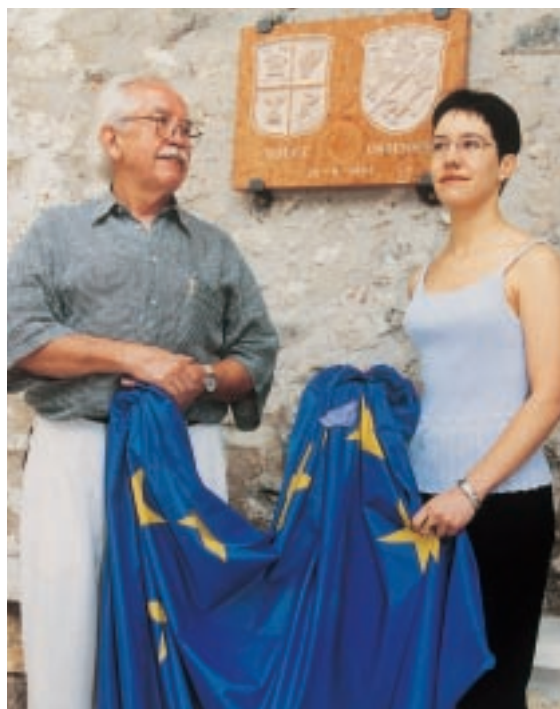
Una bella immagine del gemellaggio di qualche anno fa

imparato a conoscersi e ad apprezzarsi... "È proprio questa la linfa che rende vitale lo scambio in atto: un modo per valorizzare la nostra identità, la cultura, le tradizioni. Il gemellaggio svolge anche un'insostituibile azione promozionale e propositiva verso tanti aspetti meno noti del nostro territorio". Veniamo alle iniziative avviate ed a quelle in programma: come avete pensato di operare? "Ci siamo già attivati con il Comune e il Consorzio Vini Terratediforti per veicolare i nostri prodotti tipici alla Festa del riso di Isola della Scala e alla Festa della polenta di Vigasio. Siamo stati presenti ad entrambe le manifestazioni con ottimi risultati d'immagine portando in vetrina i nostri prodotti tipici, in particolare il formaggio di Sabbionara d'Avio e i vini della Terradeiforti. Certo, anche se questo non rappresenta l'obiettivo primario del comitato promotore dell'associazione, si tratta di una concreta possibilità di autofinanziamento perché vorremmo raggiungere l'autosufficienza economica senza gravare in alcun modo sulle spalle del Comune. Va sottolineato che abbiamo partecipato alla Festa del riso di Isola della Scala su esplicito invito del Comitato provinciale per i gemellaggi; si è trattato di un'occasione esclusiva per conoscerci e scambiare conoscenze". Cosa avete in programma per l'ultimo dell'anno? "Proprio per suggellare la nostra amicizia con Un-