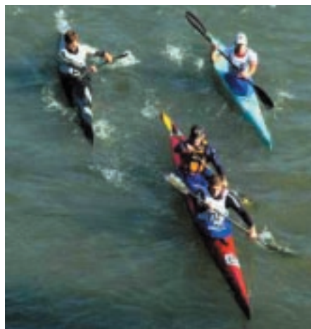
E vai con la... battaglia!