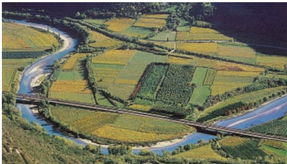
Laansa dell'Adige della Carotta di Peri (sono visibili i meandri fossili)