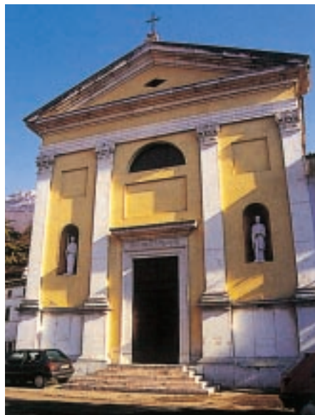
Facciata della parrocchiale di Peri