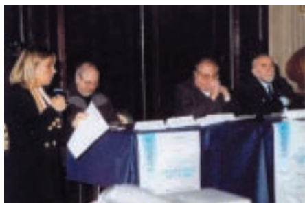
Il tavolo dei relatori

Serata intensa, di grande suggestione, quella organizzata dal gruppo El Casteleto sabato 19 novembre nella parrocchiale di Santa Lucia a Dolcè per la presentazione della dodicesima edizione della rivista La Valdadige nel Cuore . Quest’anno il tradizionale appuntamento, che ha visto la chiesa gremita in ogni ordine di posti, ha assunto un valore ancor più pregnante sia per l’argomento affrontato dagli studiosi, che hanno raccolto una ricca serie di testimonianze di sopravvissuti e narrato episodi inediti accaduti in zona durante la seconda