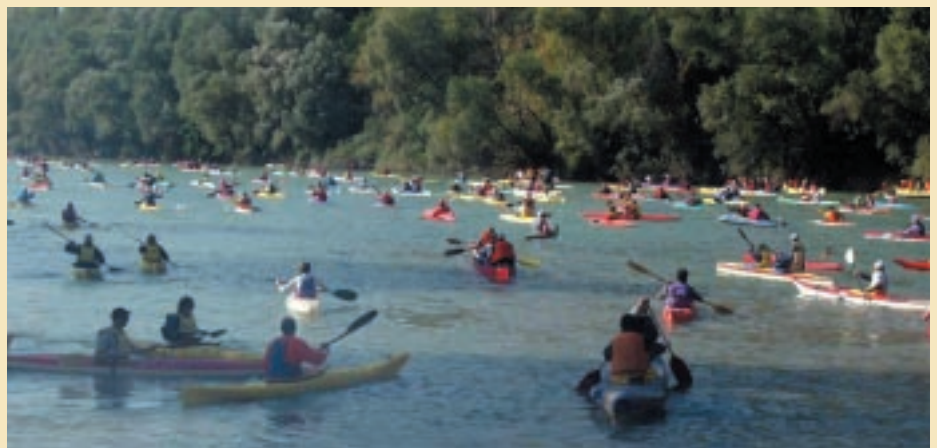
La partenza dall'isola di Dolcè

S pettacolo ed emozioni in un fiume di...colori che ha invaso l'Adige per la seconda edizione della Maratona Internazionale di Canoa e Kayak Terradeiforti, nella splendida mattinata di domenica 16 ottobre. Tra Borghetto d'Avio, partenza degli agonisti, e Pescantina, punto d'arrivo, attraversando l'isola di Dolcè, punto di partenza degli amatori. In numeri: 35 chilometri per gli agonisti, 20 per gli amatori. Lo scorso anno erano giunti lassù, in Terradeiforti, a cavallo tra Veneto e Trentino, in quattrocento; quest'anno i