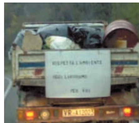
Immagine eloquente della montagna di rifiuti disseminati sul terreno e raccolti