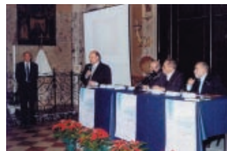
Il sindaco al tavolo dei relatori durante la serata

Verona, sono scorse sullo schermo le fotografie di quei tristi giorni, raccolte con certissima pazienza. Un album in bianco e nero tratto dalla mostra “Grappoli di bombe in Valdadige” curata da Giovanni Buio e Giorgio Lucchini. Istantanee, assai toccanti, che raccontano la vita a Peri, Ceraino e Dolcè e Volagne martoriate da terribili bombardamenti: gruppi di sfollati, case sventrate e rovine. Immagini mai rimosse, con tutto il loro peso angoscioso, dalla memoria dei più anziani, ma di fondamentale esempio soprattutto per le giovani generazioni. In sa-