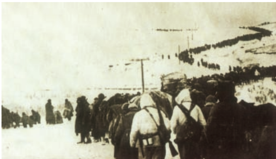
Il retro della copertina: Seconda Guerra Mondiale, 1943, ritirata di Russia