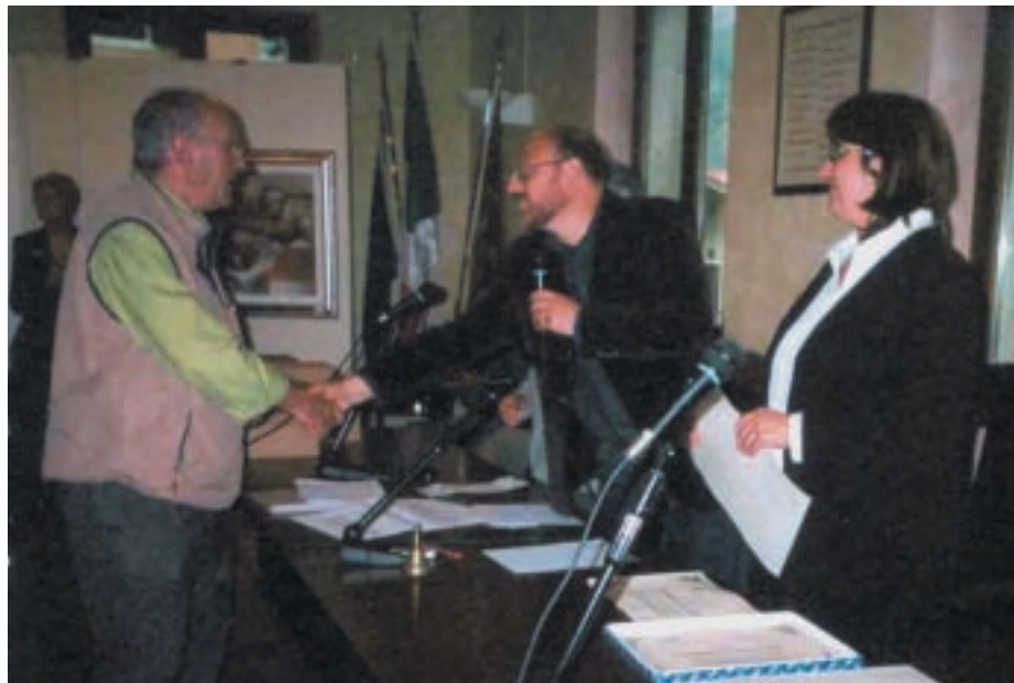
La cerimonia di premiazione a Dolcè