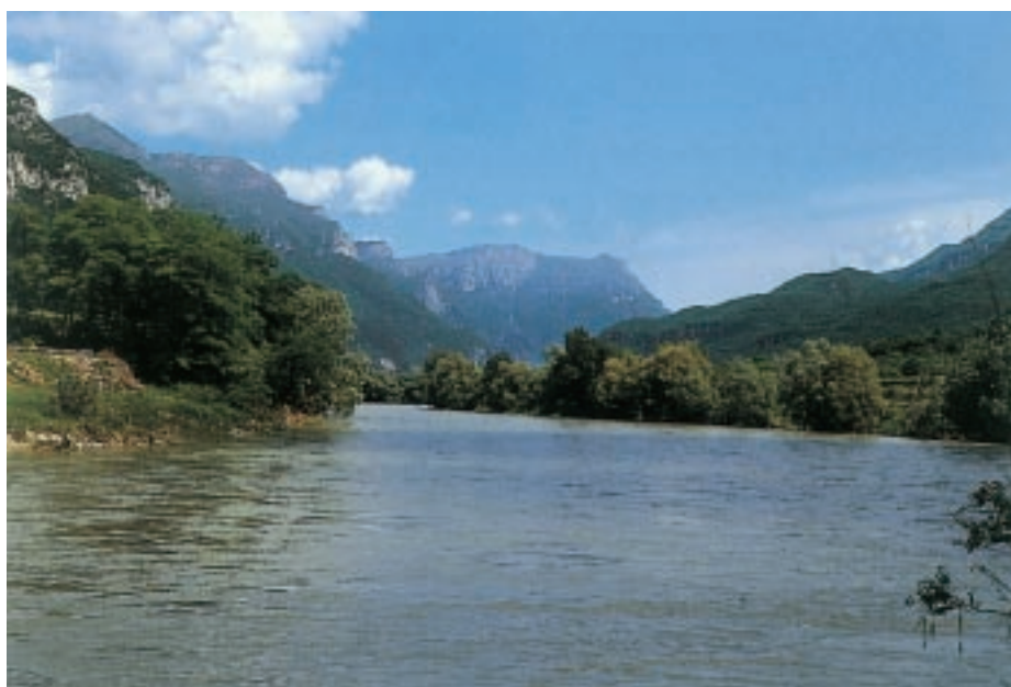
L'Adige con le sue rive boschive

Il tutto in considerazione della mancanza, ormai cronica, nell'ultimo decennio, dei cosiddetti predatori tradizionali quali il lupo e la lince».