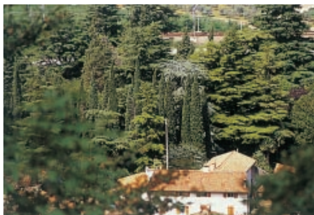
Parco della villa Guerrieri-Rizzardi

Si tratta di un complesso originariamente del tre-quattrocento, successivamente trasformato e modificato nel XVII e XIX sec. Del XV sec. è un portico architravato con tetto in scandole, mentre una barchessa con pitture geometriche nel sottogronda è del XVII-XIX sec. Al centro del cortile vi è la residenza con facciata sobria, conservante portale cinquecentesco (con sopra lo stemma dei Guerrieri) e finestre incorniciate; all'interno presenta un grande salone d'entrata, scale in pietra ed alcune stanze con soffitto a volta. Molto bello è il parco all'inglese, che si estende per cinque ettari, conservante filari di cedri e di cipressi, nonché vialetti marcati da siepi di bosso, disposti a croce attorno ad una rotonda con palma.