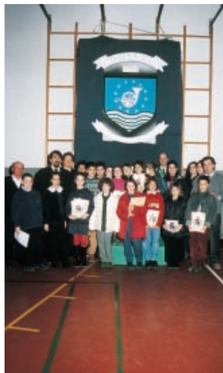
Una foto ormai "storica": la premiazione dei vincitori del concorso per il logo del corpo bandistico comunale

Il Corpo Bandistico Comunale augura alla Cittadinanza