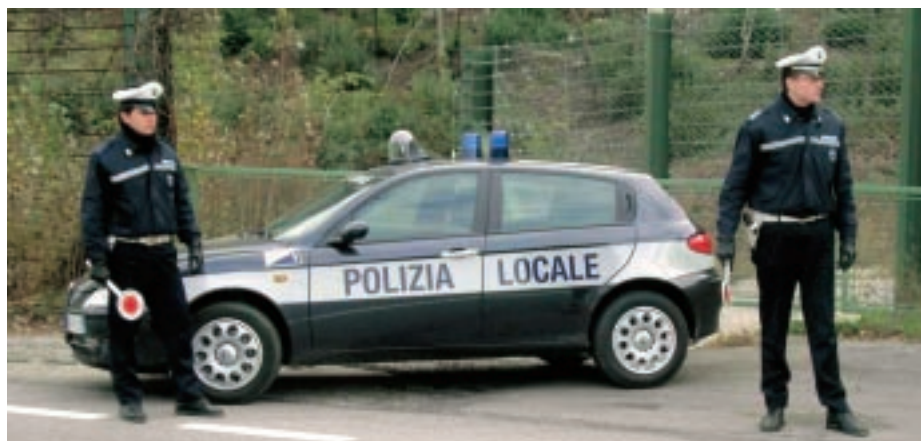
La polizia locale durante un servizio di controllo sul territorio

La stessa Fiat Punto, equipaggiata di faro cercapersone, lampeggianti e microfono, sarà revisionata da un punto di vista meccanico e data in uso al locale gruppo di Protezione Civile.