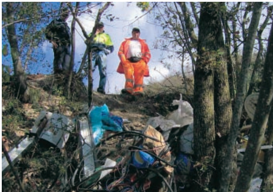
Due significative immagini della Giornata Ecologica