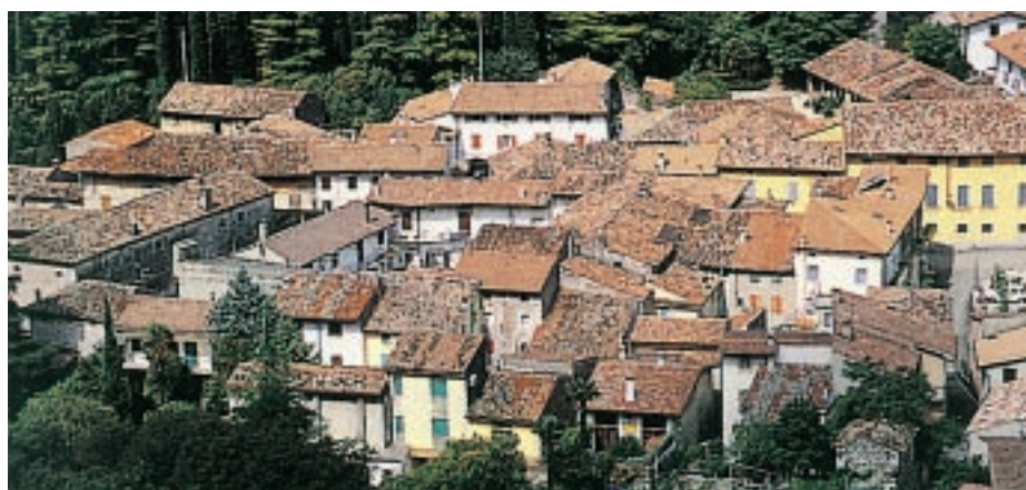
Nuclei a corte nel centro storico di Dolcè