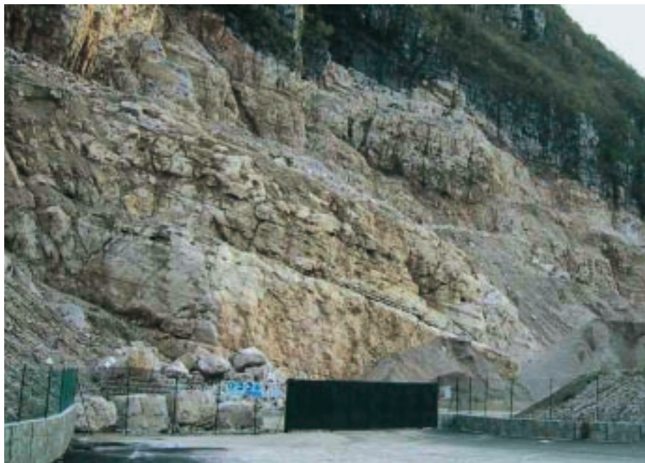
Una cava sul territorio comunale

È noto che l'uomo, in qualità di essere pensante, sopperisce alla limitatezza della forza fisica con la propria intelligenza; deforestare una foresta pluviale è opera titanica; le piante, appena tagliate, ricrescono; la foresta si riprende il suo territorio; le radici distruggono le opere dell'uomo, spaccano l'asfalto, deteriorano il cemento; non c'è nulla da fare pensando ad una lotta testa a testa, quindi si agisce in altro modo: si tagliano gli alberi lungo file parallele, sufficientemente vicine, anche se non vicinissime, e si incendiano queste file; i bordi delle strisce distrutte rimangono intaccati, e prima che il verde si ricostituisca, arretrano di una certa misura a causa della esposizione agli agenti atmosferici e all'erosione; prima che questo fenomeno abbia il tempo e lo spazio di arrestarsi, l'arrestamento del bosco è tale che incon-